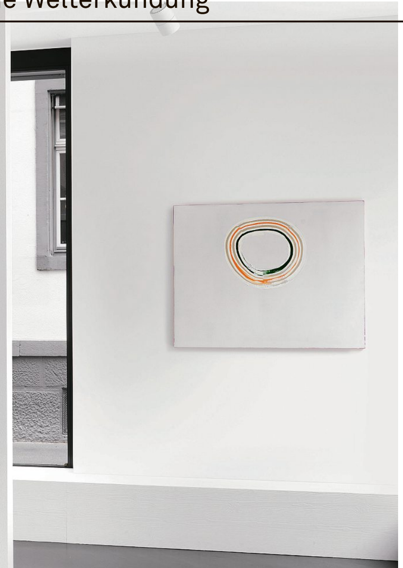
#1001217 Terra (Monte Amiata) und #971117 Terra (Alba Albula), Ausstellungsansicht, Anne Mosseri-Marlio