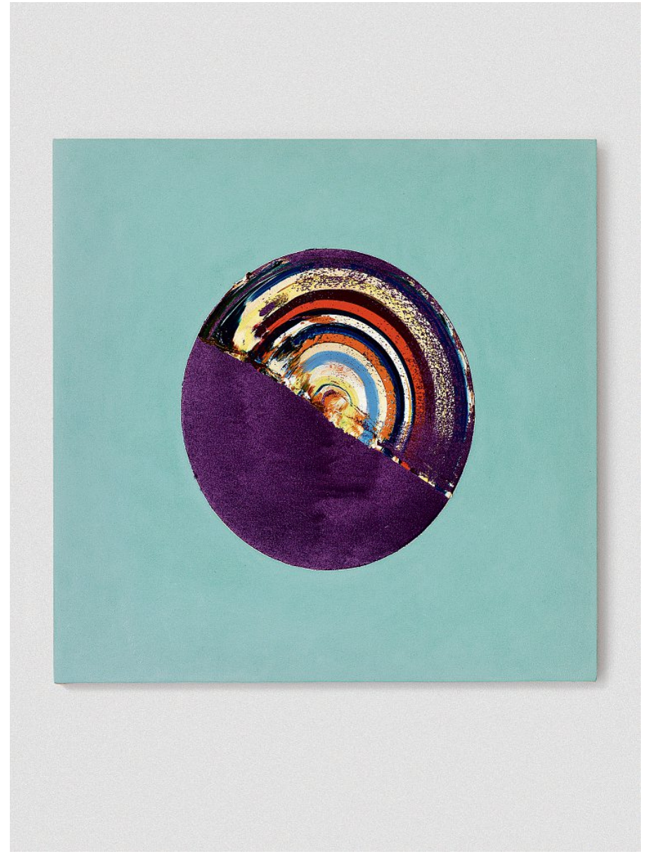
#1080118 The Fools (Bouffon), 2018, Oil on cotton on wood, 50,7 x 56,3