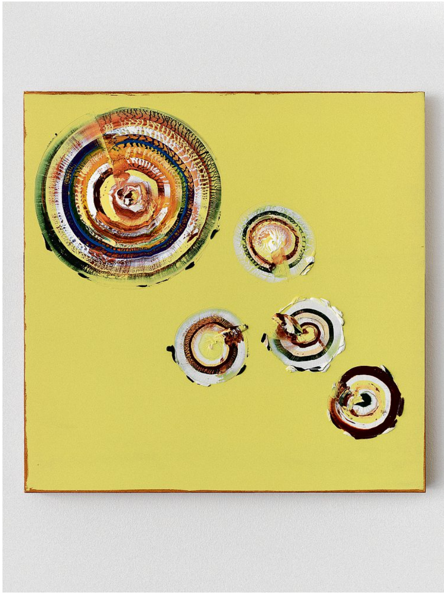
#1011217 Terra (Jarosit), 2017, Öl auf Holz, 60x60 cm